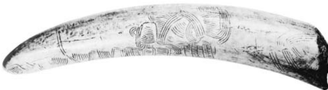
Rytá kresba na mamutím klu složená ze čtyř ornamentálních motivů (Pavlov 1962)

mamutů se podařilo získat při odkryvech u Pavlova. Objevy chat podávají svědectví, že k jejich budování bylo použito dřeva a velkých mamutích kostí. Našlo se také velké množství kostěných a kamenných předmětů a nástrojů, zdobených rytými geometrickými vzory. Objevilo se také mnoho úlomků zvířecích a lidských sošek z pálené hlíny.