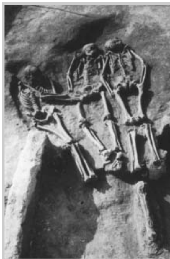
Pohřeb tří jedinců z období mladého paleolitu, Dolní Věstonice (cca 25000 př.n.l.).

Kromě mamuta se v okolí Pavlovských vrchů pohyboval medvěd, nosorožec srstnatý, sob, tur, kůň, lev, liška lední a zajíc sněžný.