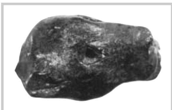
Soška lvíce z pálené hlíny (Pavlov 1962)