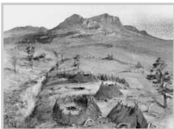
Sídliště lovců mamutů pod Pavlovskými vrchy (pouze dohad)

Geografická poloha jihomoravské nížiny na dolním