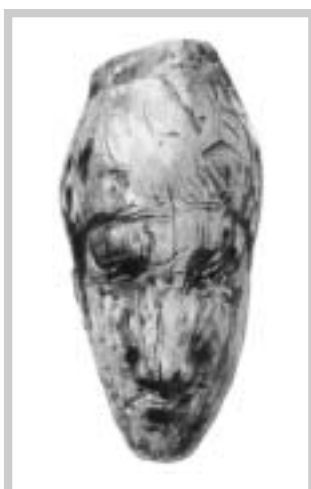
Soška ženy z mamutoviny (Pavlov)