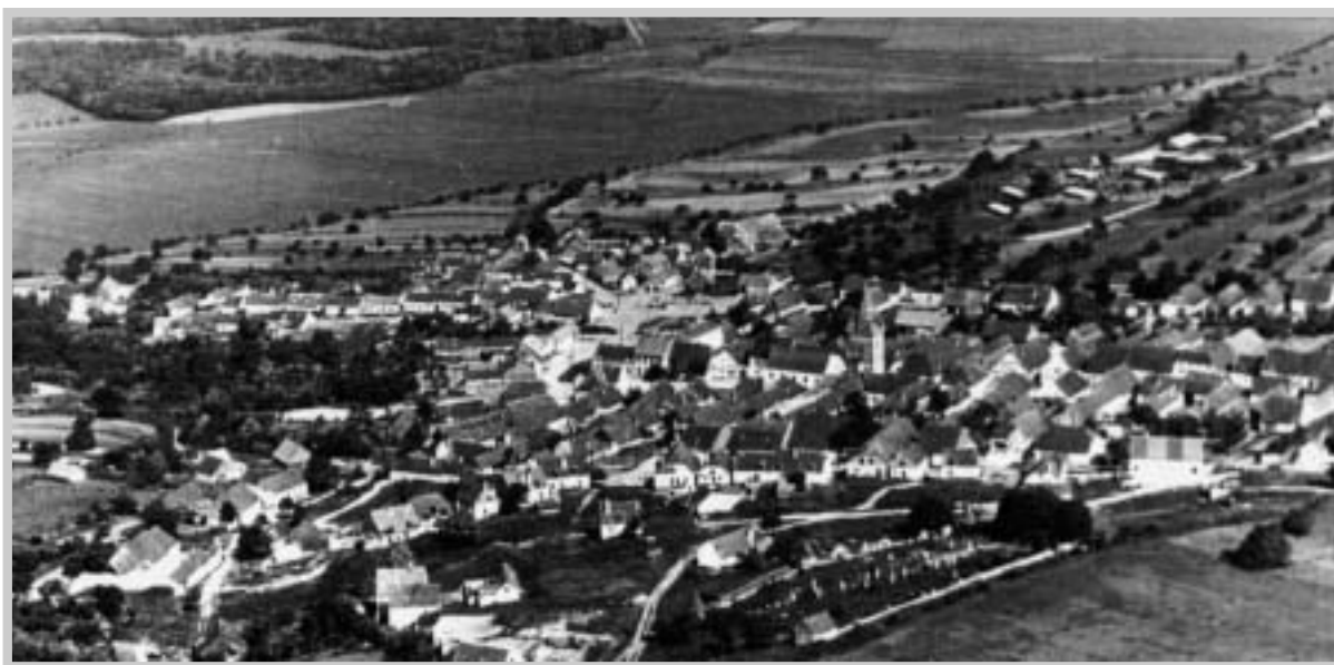
Pohled z hradu na Pavlov

velkého patrimonie pánů erbu lekna, se tak nakonec stal řadovým příslušenstvím mikulovského panství. Byl ale po větší část doby vsí hospodářsky nejvýznamnější a nejvýnosnější. Vysoká vinohradní činže 147 zlatých a 12 krejcarů nasvědčuje, že Pavlov byl tehdy největší vinařskou obcí na Mikulovsku. Zahradní činže, která se v urbáři z roku 1574 objevuje vůbec poprvé, nasvědčuje tomu, že obec tehdy prosperovala