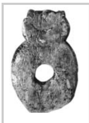
Závěs v podobě sovy (reliefní plastika z mamutoviny, Pavlov 1953)