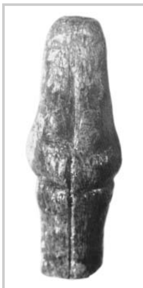
Soška ženy z mamutoviny (Pavlov)