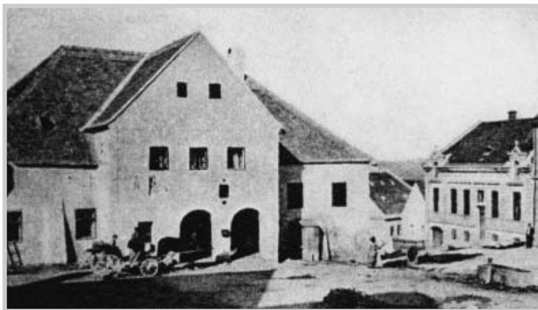
Budova obecního úřadu, kde se nacházel obecní hostinec a do roku 1862 i škola. (pohlednice, 1890)

Při dolní straně budovy, naproti domu čp. 36, se nacházel malý dvorek, kde byl záchod, který sloužil nejen učitelské rodině, ale i školákům a návštěvníkům