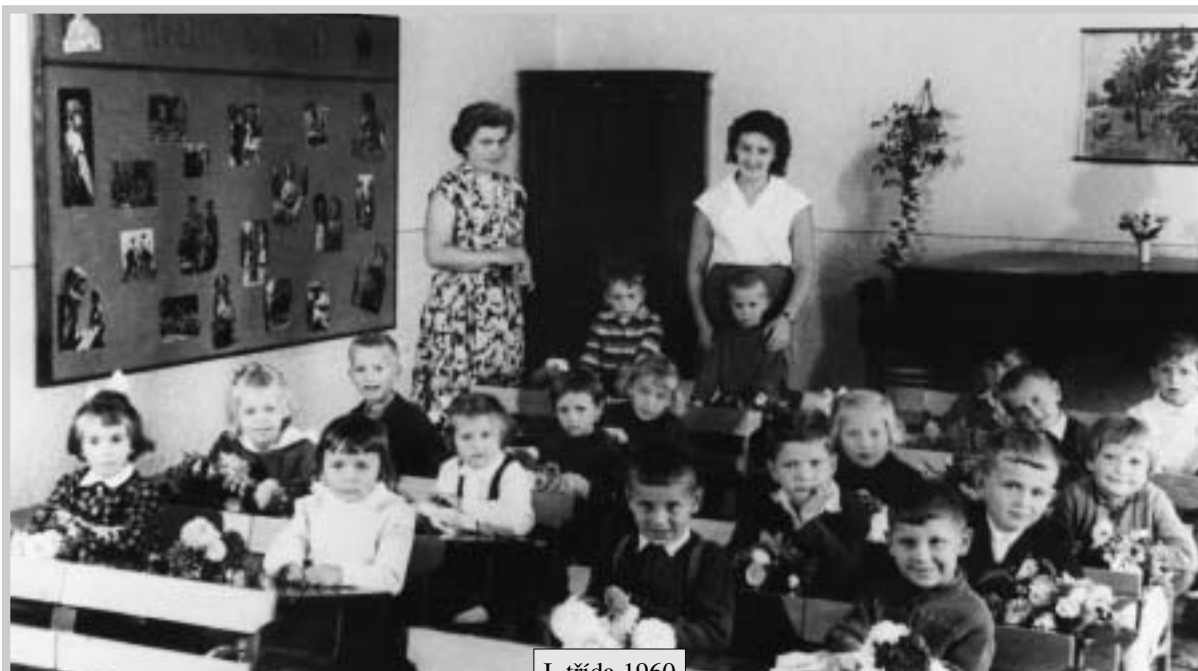
I. třída 1960