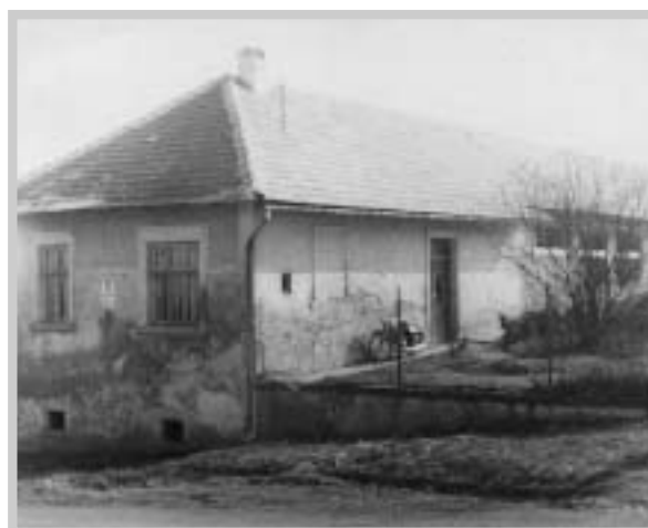
Budova mateřské školy (M. Martišová, 1965)