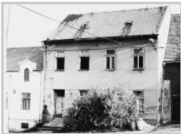
Chátrající školní budova (J. Pavůčková 1990)

Od roku 1977 budova zdejší školy chátrala a chátrala. Roku 1993 byla zahájena generální oprava školní budovy, která se nacházela již ve značně dezolátním stavu. Pro nedostatek finančních prostředků byly sta-