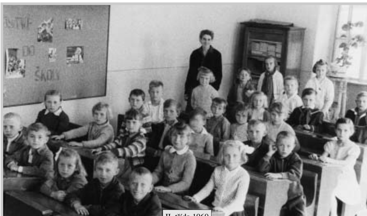
II. třída 1960