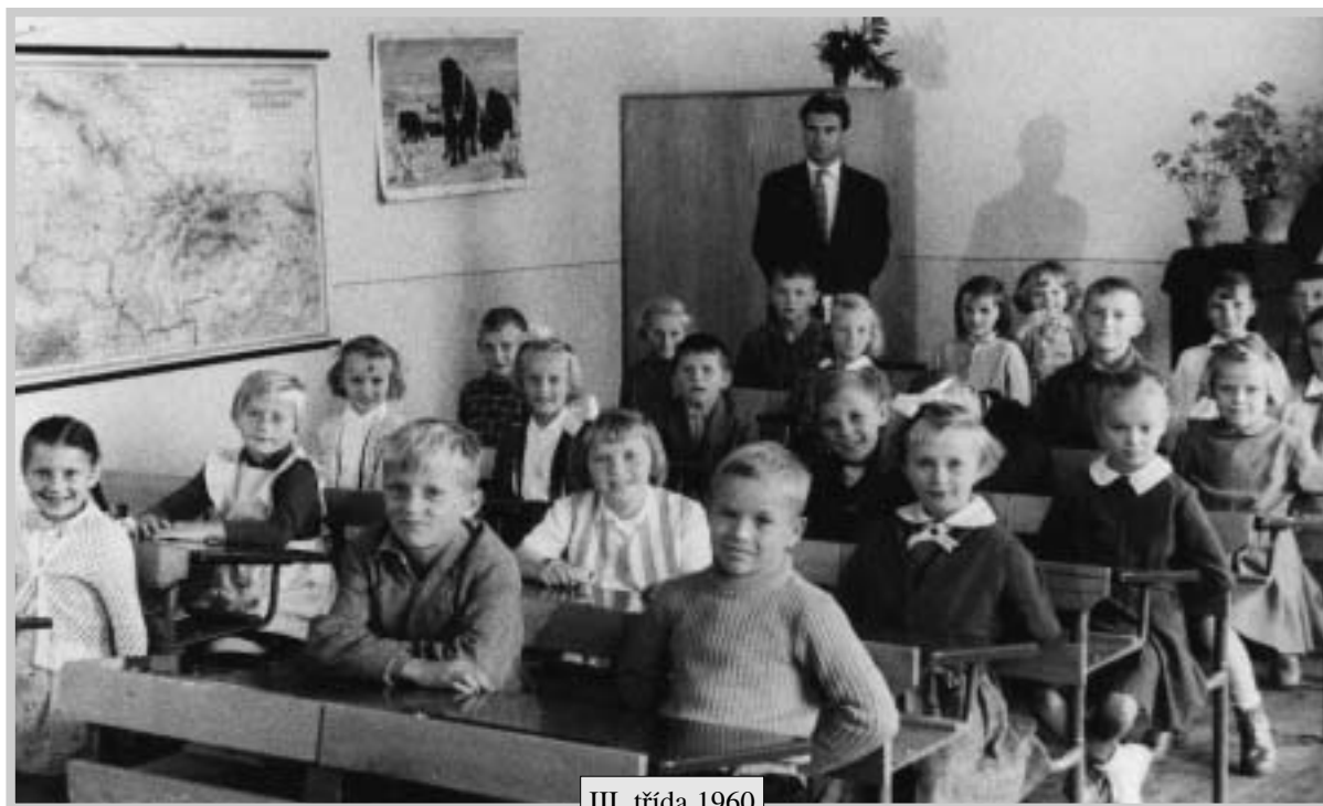
III. třída 1960

Na snímku III. třída, t.j. 3. a 5. postupný ročník.