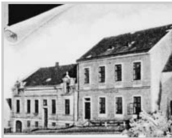
Budova školy (kolem roku 1900)

Rozhodnutím obecní rady ze dne 3. března 1927 byl pod Pavlovem na rozcestí Dolní Věstonice–Milovice