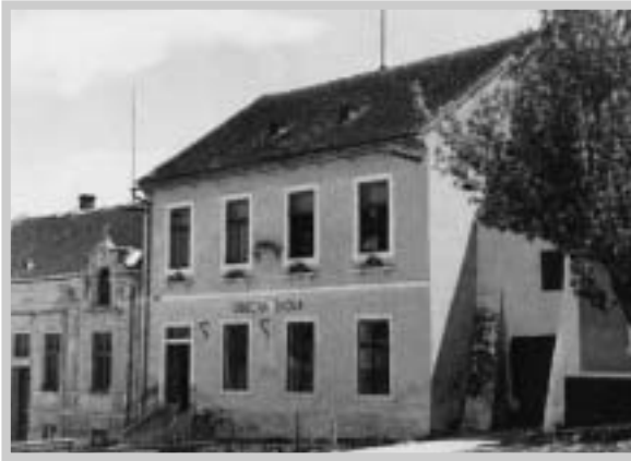
Obecná škola (1945)