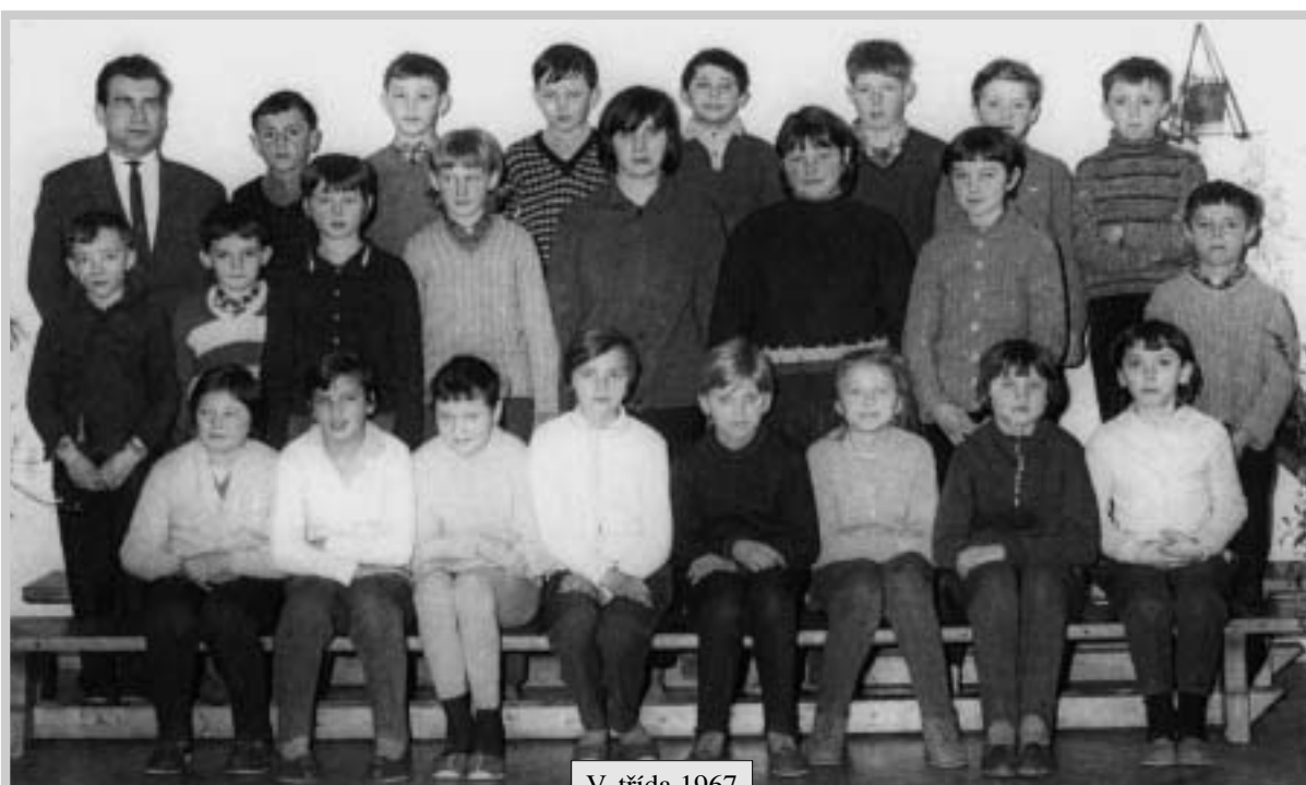
V. třída 1967