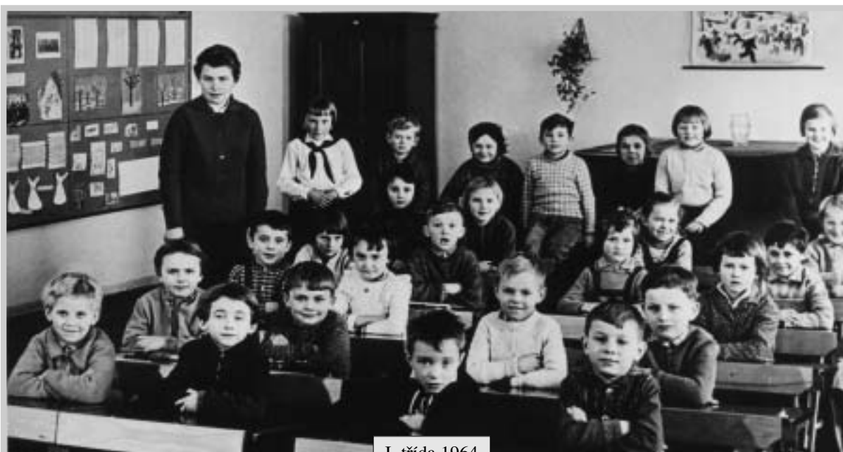
I. třída 1964