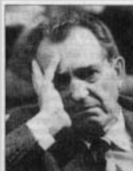
Šéfidolog KSČ Vasil Bifak byl zhroutil stranou zrcen.

Několik tisícovek Pražanů se vydalo z Václavského náměstí na pochod centrem města. Přístup k Pražskému hradu jim znemožnily policejní kordony. Ve 20 hodin bylo v Činoherním klubu ustavující shromáždění Občanského fóra (OF). Na jeho vzniku se podíleli zástupci nezávislých občanských iniciativ, oficiálních struktur a představitelé kultury a studentů. Václav Havel definoval OF jako otevřené opoziční uskupení, které chce jednat s vládnoucí mocí o politických změnách.