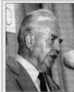
Poslední komunistický premiér Ladislav Adamec předával moc.

Společná schůze obou komor Federálního shromáždění zrušila články 4, 6 a 16 Ústavy ČSSR. Tyto články zakotvovaly vedoucí úlohu KSČ ve společnosti, v Národní frontě a povinnou výchovu v duchu marxismu-leninismu. Současně byla vytvořena první parlamentní komise k vyšetření událostí 17. listopadu. Rezignoval tehdejší předseda Federálního shromáždění Alois Indra. Ladislav Adamec se poprvé zmínil o nutnosti přehodnotit pohled na rok 1968 a o odchodu sovětských vojáků z ČSSR.