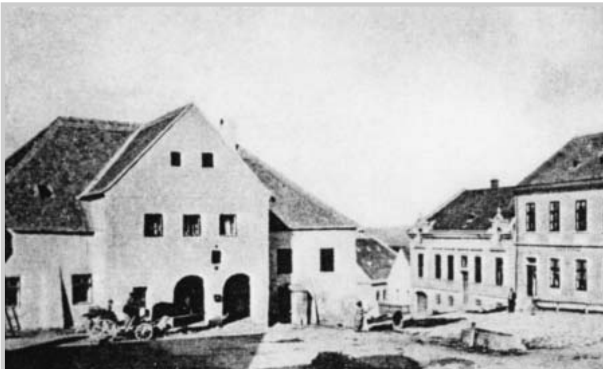
Budova radnice s obecním hostincem, kterou postavili novokřtění roku 1617 – pohlednice z roku 1890