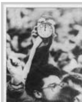
Politický zvrát byl odstartován studentskými demonstracemi.