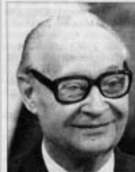
I první muž pražského jara Alexander Dubček boural KSČ.

V 16 hodin začalo v Praze na Albertově povolené shromáždění k uctění památky studenta Jana Opletala. V 18 hodin skončila oficiální část manifestace, účastníci se vydali do centra města. Průvod, který v té době tvořilo asi padesát tisíc lidí, se dostal až k Národnímu divadlu. O půl osmé demonstranty zastavil policejní kordon. Kordony postupně stlačovaly uvězněný dav. Ve 21.10 hodin byla demonstrace rozehnána. Při policejním zásahu bylo zraněno více než 590 lidí.