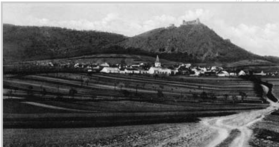
Pavlov s hradem, 1940