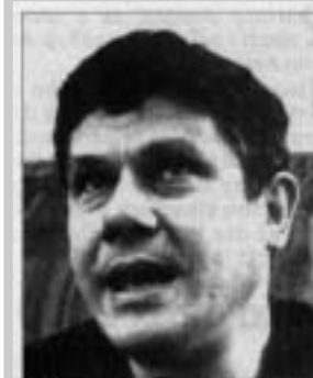
Výraznou osobností sametové revoluce byl kněz Václav Malý.

Zástupci OF a vlády dospěli k dohodě o sestavení nové federální vlády a o změně tří článků Ústavy, z nichž nejvýznamnější bylo zrušení vedoucí úlohy komunistické strany. Současně bylo navrženo, aby byli odvoláni poslanci Federálního shromáždění, ČNR, SNR a národních výborů, kteří se zpronevěřili svému poslanceckému slibu a nedbali vůle a zájmů lidu. Vedení KSČ v čele s novým tajemníkem Karlem Urbánkem svolalo celostátní aktiv k přípravě mimořádného sjezdu strany.