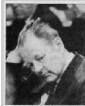
První tajemník KSČ Miloš Jakeš přestal dostávat rady z Moskvy.

Vina skutečné občanské aktivity a iniciativy se vzedmula. Od 12 do 14 hodin došlo k manifestacní generální stávce. Přestala pracovat polovina obyvatel země. Svou podporu stávce mnozí lidé vyjádřili zvonením či zapnutými klaksony. Většina účastníků stávky si ztracený čas nadpracovala. Hlavním požadavkem stávkujících byl odchod nejzkompromitovanějších politiků z vedení KSČ. Ve většině měst proběhly odpoledne a večer další manifestace na podporu požadavků OF.