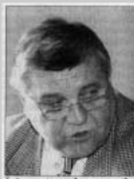
Šéf pražské KSČ Miroslav Štěpán nechtil pochopit svůj konec.