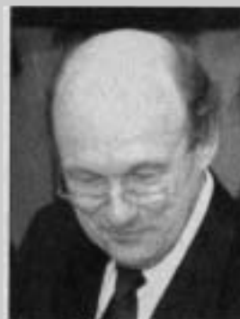
Marián Čalfa se stal z rudého ministra „sametovým“ premiérem.

Z balkónu budovy Melantrichu poprvé promluvil i nejznámější představitel opozice Václav Havel, který přítomných asi 200 tisíc lidí seznámil se smyslem a cíli Občanského fóra. Za průlom v jednání s tehdejší vládnoucí garniturou lze označit první setkání představitelů opozice s tehdejším federálním premiérem Ladislavem Adamcem. V televizi vystoupil generální tajemník KSČ Miloš Jakeš, který vyzval k reformám, pokračování přestavby, ale také obhajobě hodnot socialismu.