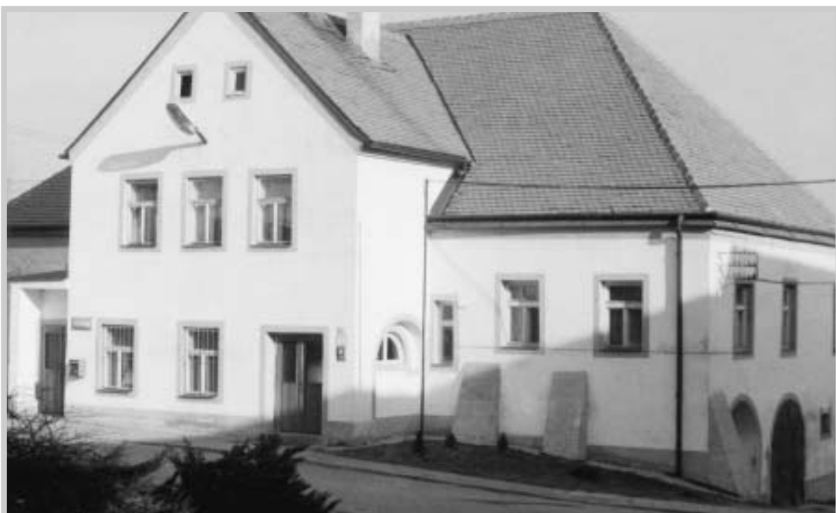
Pohled na budovu radnice roku 1990 (J. Pavůčková)