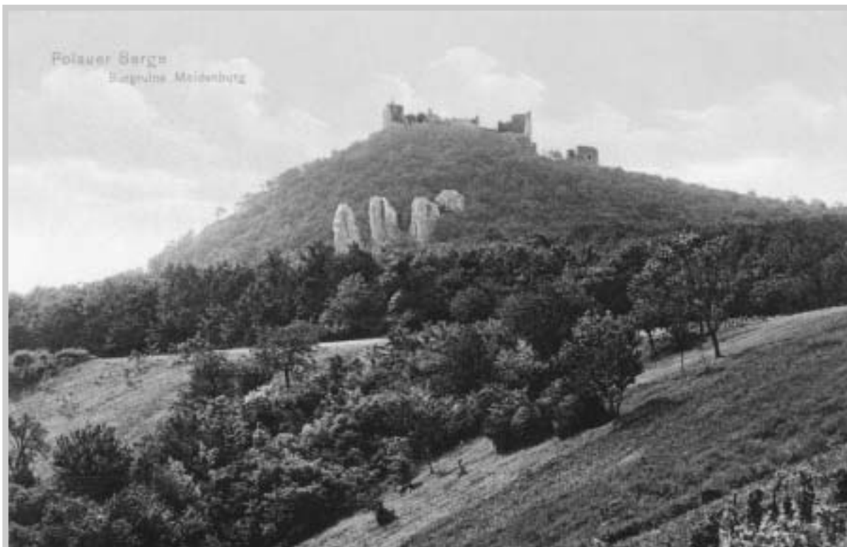
Aschler a Redlich, Brno 1912

Když však spatřil princezniny četné perly a šperky, byl jejich nádherou přímo oslněn. Touha zmocnit se tohoto bohatství byla tak mocná, že se rozhodl sprovodit všechny tři dívky ze světa. V temné bouřlivé noci přepadl se svými sluhy spící dívky, dal je zavraždit a jejich mrtvoly kázal vyhodit oknem do propasti. Jak se však příštího jitra ulekl, když před svým hradem spatřil tyto tři dívky zkamenělé. Stály tu jako vysoké skalní útesy a neustále jako sousoší pomsty zlobně hleděly do hradních oken. Hradní pán nesnesl jejich vyčítavě pronásledujících pohledů, nakonec zešílel. Jakmile se chán Batu dověděl o zavraždění své dcery, vrhl s vojskem do Evropy, aby se pomstil. Jeho hordy táhly i na Moravu a strašlivě ji zpusťily.