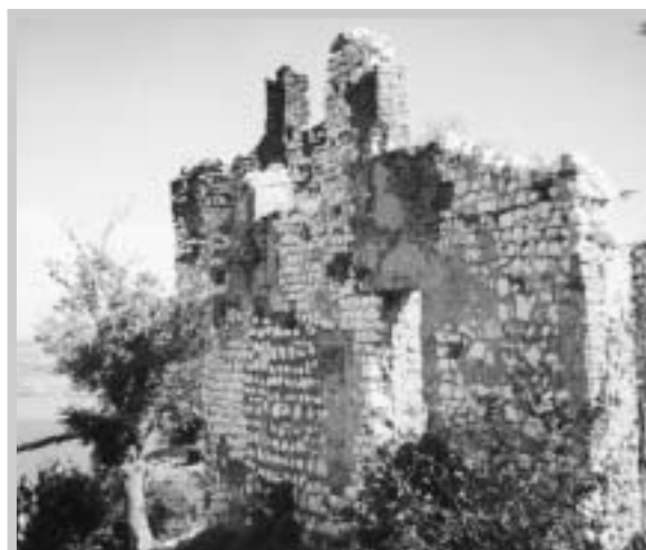
Předsunutá bašta od východu (V. Vajay, 1995)