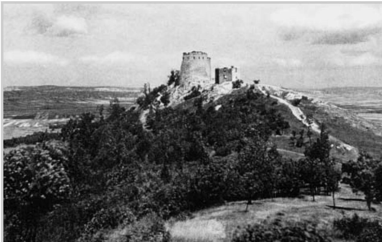
Pohled na zříceninu hradu Děvičky. V záběru předsunutá dělová bašta a západní oblé čelo plášťové zdi.