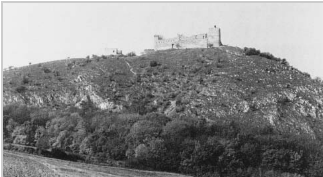
(J. Maca, 1980)