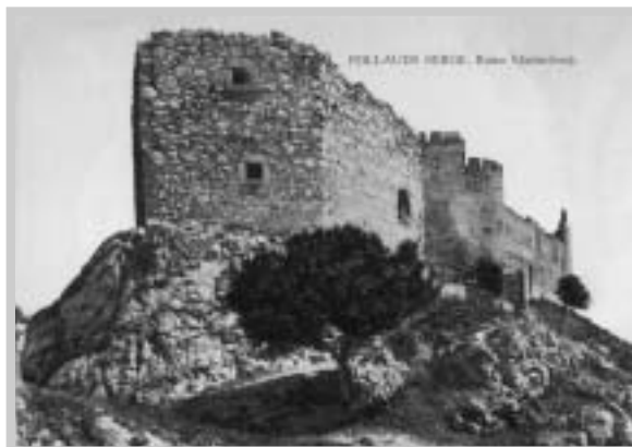
(A. Bartoš, Mikulov, 1904)