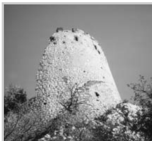
Západní oblé čelo plášťové zdi (V. Vajay, 1995)