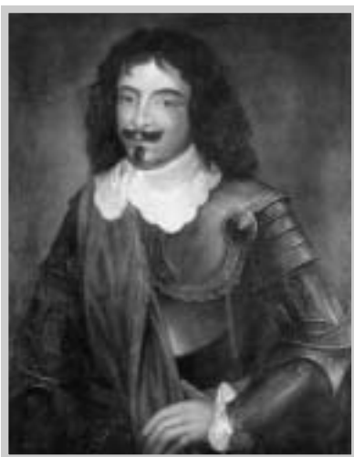
Raduit de Souches – 2. dubna 1646 vyrval nenadálým nočním útokem Děvičky ze švédské moci

Když tento zvoník roku 1784 zemřel, upustilo se od zvonění a zvon s nápisem MATHIAS REX byl přes protest místních občanů prodán za 200 zlatých kostelu v Klentnici. Všechno dříví i železné zařízení bylo tehdy odneseno. Hrad postupně chátral, až se nakonec proměnil v neudržovanou zříceninu, jíž jest dodnes. V dobách tureckého nebezpečí hrál hrad důležitou roli v budované obraně. Tehdy bylo vylepšeno jeho opevnění a přistavěna dělová bašta.