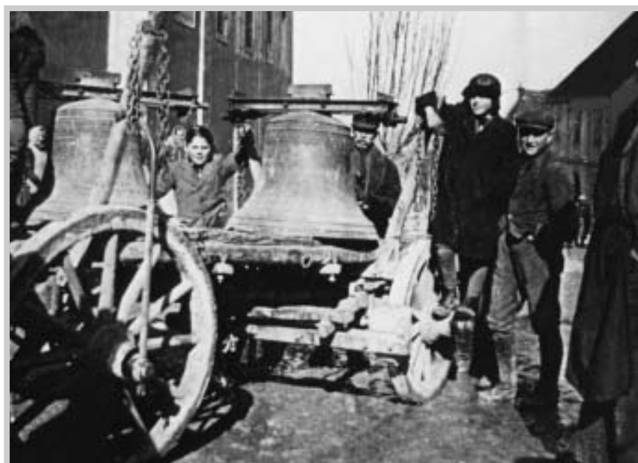
Odvoz pavlovských zvonů (koncem roku 1942)