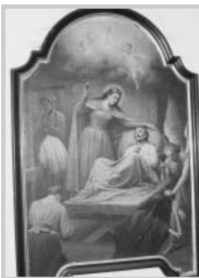
Původní obraz sv. Barbory z hlavního oltáře

Boční oltáře pocházejí z druhé poloviny 18. století