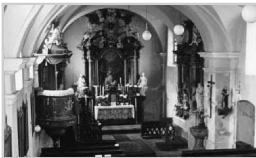
Vnitřní část kostela – v pozadí hlavní oltář s plastikami sv. Kateřiny a sv. Apolonie od Ignáce Lengelachera (J. Maca, 1965)

komponentů z varhan předchozích, přidáno 96 píšťal, z toho 25 cínových. Novou varh. skříň zhotovil místní stolař Hofmann za 40 zlatých.