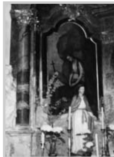
Boční oltář sv. Maří Magdaleny (J. Maca, 1985)

Boční oltáře pocházejí z druhé poloviny 18. století