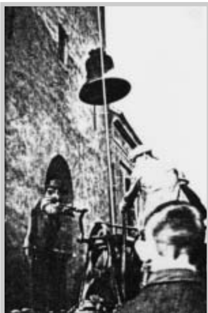
Spouštění zvonu s věže (1942)

Také druhá světová válka zasáhla do dějin kostela. Koncem roku 1942 byly pro válečné účely vykoupeny a odvezeny tři velké zvony, mezi nimi i „velký zvon“ z roku 1691. Šťastnou náhodou k roztavení tohoto zvonu již nedošlo. Po skončení války byl do Pavlova navrácen a 16. listopadu 1947 slavnostně zavěšen.