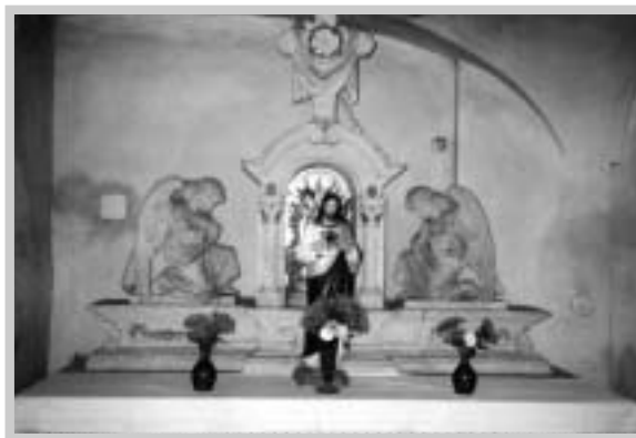
Malý oltář s božím hrobem u hlavního vchodu vlevo, byl zakoupen r.1811 za 3000 zlatých (V. Vajay, 1990)