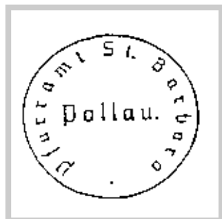
od roku 1939 do roku 1945