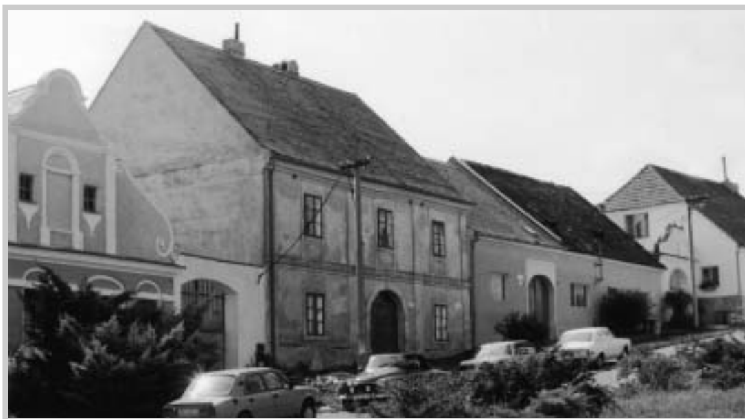
Jednopatrová farní budova (1989)