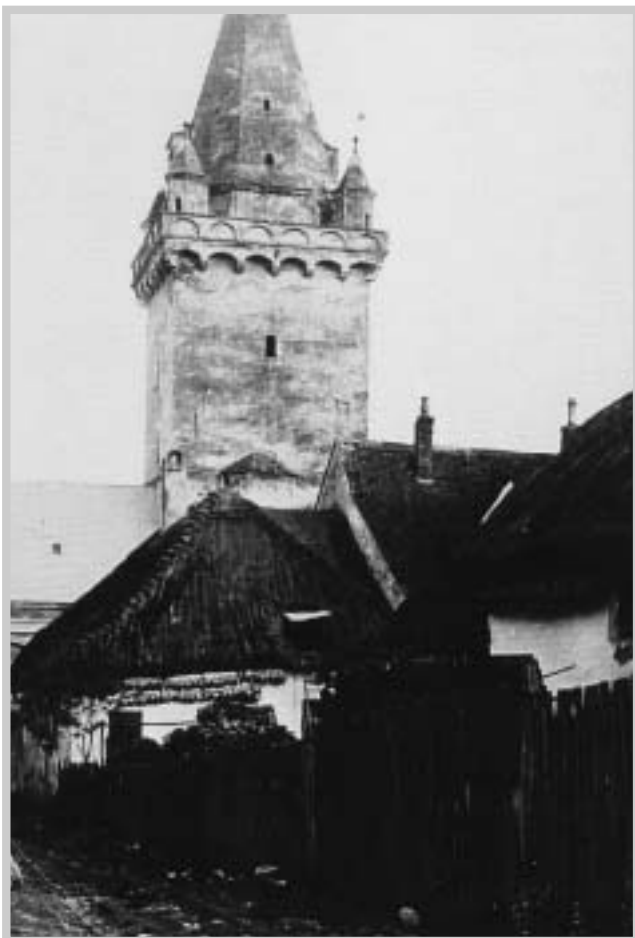
Pohled na věž z kostelní (pekařské) uličky (kolem roku 1900)

světlo udržovat, tak byl chudičký. Roční náklad na udržování věčného světla činil asi 30 zlatých.