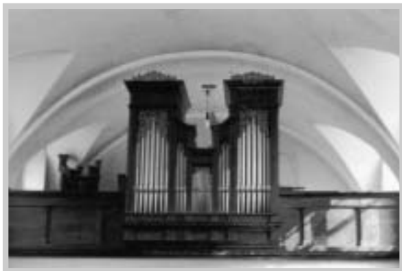
Trojdílnou barokní varhanní skříň zhotovil znojemský stavitel varhan Benedikt Latzl a byly zakoupeny r. 1890 za 700 zlatých (J.Maca, 1985)