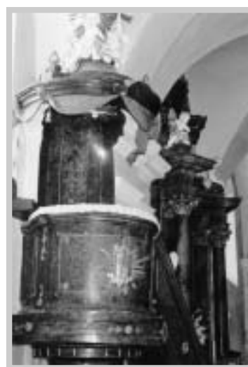
Kazatelna z 2. poloviny 18. století – (J. Maca, 1985)