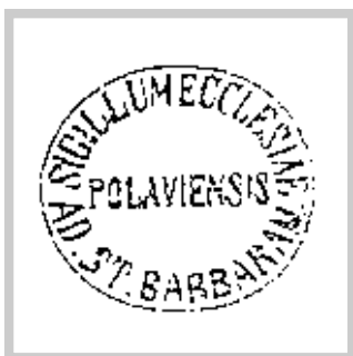
„Pečeť kostela sv. Barbory v Pavlově“