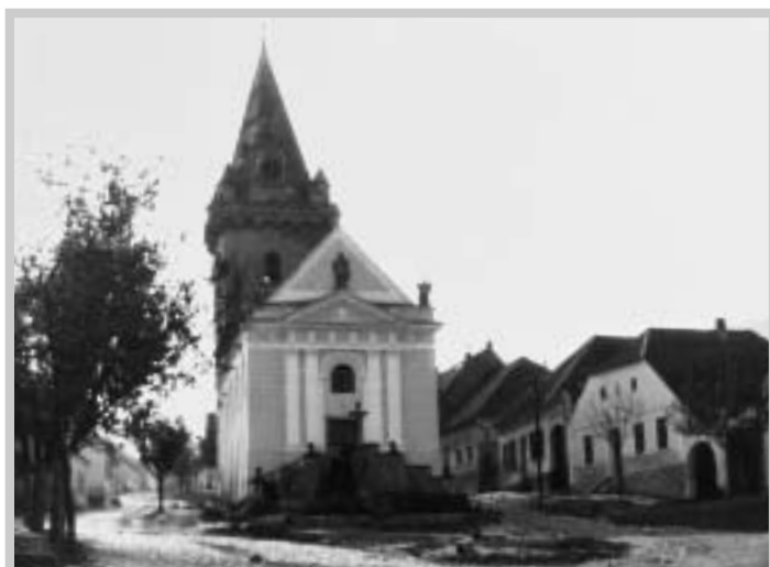
Pavlovský kostel (1944)

Mše svatá je sloužena nyní v sobotu, poslední týden v měsíci v neděli dopoledne. Kostel navštěvuje 20–25