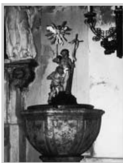
Křtitelnice z 2. poloviny 18. století – (J. Maca, 1985)