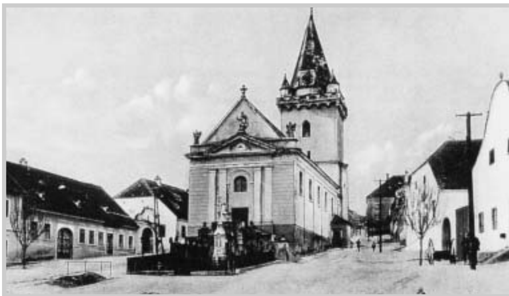
Pavlovský kostel (1900)

i když je pravděpodobné, že je v depozitáři Okresního archivu v Mikulově.