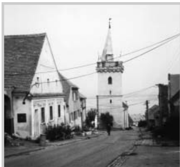
Věž kostela (J. Maca, 1990)

Zdejší kostel, který se nachází ve střední části obce, je zasvěcen svaté Barboře.