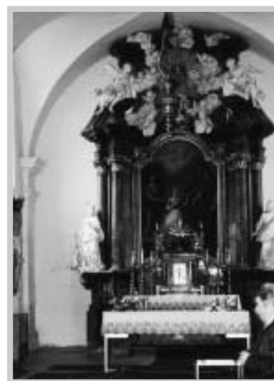
Hlavní oltář s obrazem sv. Barbory, který byl zakoupen roku 1901