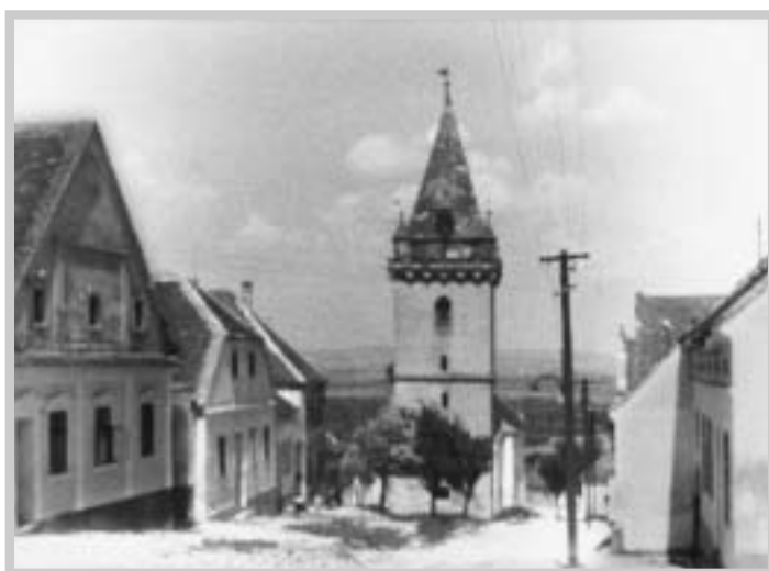
Kostelní věž – do roku 1945 majetkem obce (1944)