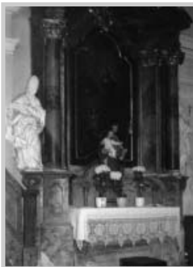
Boční oltář sv. Pankráce na epištolní straně s plastikami sv. Řehoře a Lva Velkého (J. Maca, 1985)

bez nápisu. – Hlavní oltář sv. Barbory, vedlejší oltáře sv. Pankráce a sv. Maří Magdaleny, kazatelna – vše nově štafírováno roku 1841 nákladem 629 zlatých. Bohoslužebná roucha jsou v přiměřeném stavu, počítá se s jejich postupnou obnovou. – Kostelní stříbro, které roku 1806 obnášelo 6 liber a 87 lotů, bylo roku 1810 odevzdáno státu na sanaci měny. Fara, připomínaná k roku 1181 a 1276 v seznamu beneficí kounického kláštera, zanikla a není již uváděná v seznamu k r. 1537