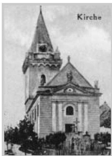
Pavlovský kostel (1900)

provedl akademický malíř Matyáš Šťastný z Brna res-