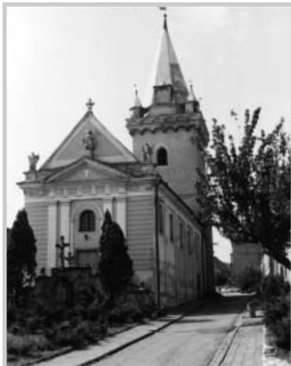
Kostel v Pavlově 1989

Svatou Barboru uctívali také horníci, kterým je rovněž patronkou.