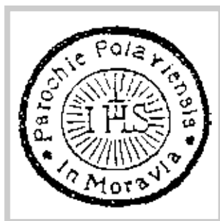
Farnost v Pavlově na Moravě