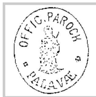
do roku 1939